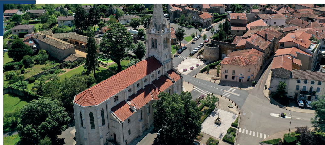
Au départ de l'église