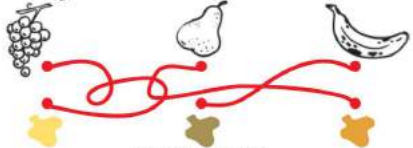
couleur du cadre

Place-toi face à l'hôtel de ville. Tu peux voir, dans ton dos, une des entrées de la sous-préfecture. Quel fruit reconnais-tu à côté de la tête du personnage barbu?