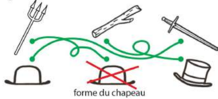
forme du chapeau

Retrouve la fontaine dans le passage. Le poisson s'est entouré autour d'un objet. Mais de quel objet s'agit-il?