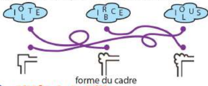
forme du cadre

Tu vas découvrir la forme du cadre du tableau.