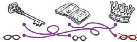
forme des lunettes

Observe la statue qui se trouve juste au-dessus de la porte d'entrée de l'église. Que tient-elle dans sa main gauche?