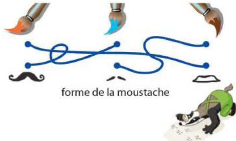
forme de la moustache

Quel pinceau serait inutile pour repeindre cette mosaïque?