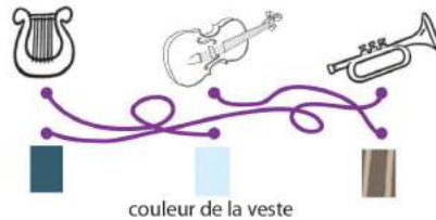
couleur de la veste

Observe bien ce mur peint qui nous paraît si réel. L'un des personnages tient une caméra. De quel instrument de musique joue le personnage à ses côtés?