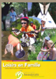
Guide Loisirs en Famille 3 000 exemplaires