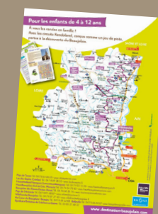
Flyers Randoland : 10 000 exemplaires A disposition à Destination Beaujolais